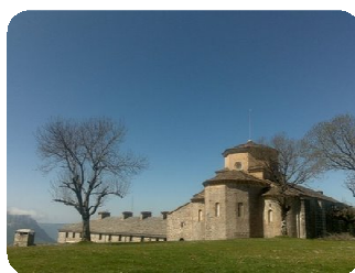
Santuario de San Miguel de Aralar

Una vez rodeamos este embalse, comienza la subida más dura del día, la cual nos permitirá disfrutar de las impresionantes campos de la Sierra de Aralar y de sus bosques de hayas. Seguiremos disfrutando hasta llegar a la casa Forestal. De aquí nos quedan 2,5 km de carretera hasta llegar al Santuario de San Miguel de Aralar, ermita románica que merece la pena visitar. Las vistas en esta atalaya son impresionantes, nos permiten otear a vista de pájaro el valle que conforma la zona de la Sakana (valle entre la Sierra de Urbasa y Aralar).